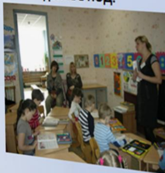
Наблюдение в НОД.