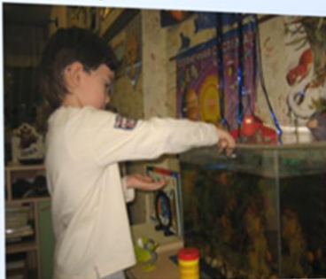
Наблюдение в уголке природы.